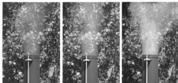
20% - Максимально допустимо 40% - Не легально 80% - Грубое нарушение!